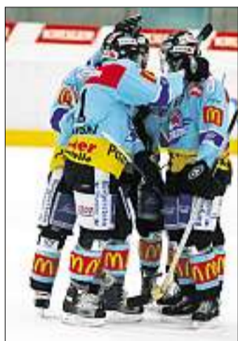
Geschafft: Lakers-Spieler bejubeln den Playoff-Einzug.

Mit energiepolitischen Massnahmen will der Bundesrat zudem den Verbrauch fossiler Energien um 20 Prozent senken. Der Anteil an erneuerbaren Energien soll dagegen um 50 Prozent steigen, und der Anstieg des Stromverbrauchs auf maximal 5 Prozent begrenzt werden. Links-Grün kritisierte dies als «Pseudo-Klimaschutz». Mit dem Verzicht auf eine Benzinabgabe riskiere der Bundesrat, dass der CO 2 -Ausstoss im Verkehr weiter ansteige und die gesteckten Ziele nicht erreicht würden. Zufrieden zeigten sich die bürgerliche Mitte und die Wirtschaft: Der Klimarappen ist laut FDP ein funktionierendes Instrument. (sda) Seite 11